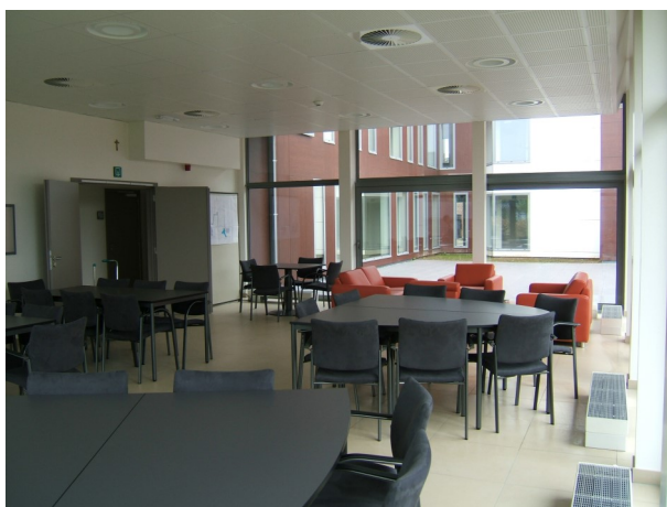
De polyvalente zaal

U geniet in een woning dezelfde privacy en vrijheid als deze die u heeft in uw huidige thuissituatie. U kiest immers voor zelfstandig wonen, met daaraan gekoppeld de mogelijkheid om, volledig vrijblijvend, beroep te doen op de voor u best passende services.