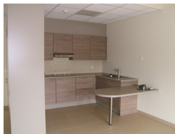
Voorbeeld keuken in een woning.

Een parlofoon aan de inkom, aansluitingen voor telefoon, TV-distributie en internet horen bij de standaarduitrusting. Er is eveneens een interne telefoonlijn, waar gratis gebruik van kan worden gemaakt binnen de assistentiewoningen en het rustoord.